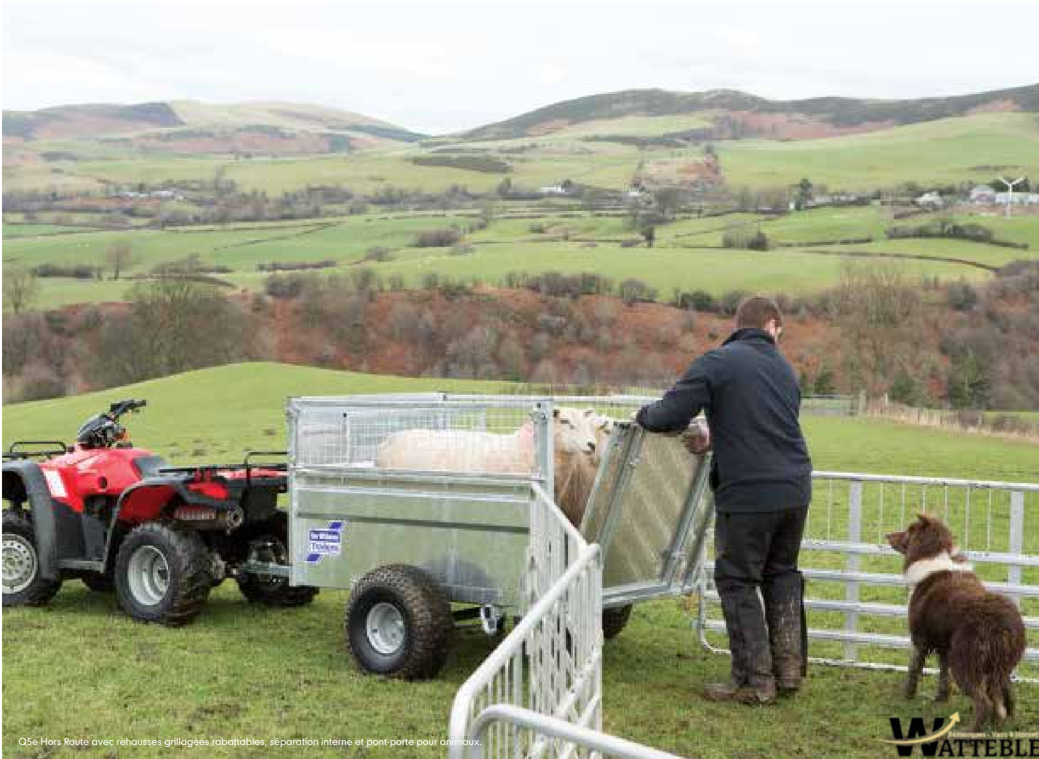
Q5e Hors Route avec rehausses grillagées rabattables, séparation interne et pont-porte pour animaux.