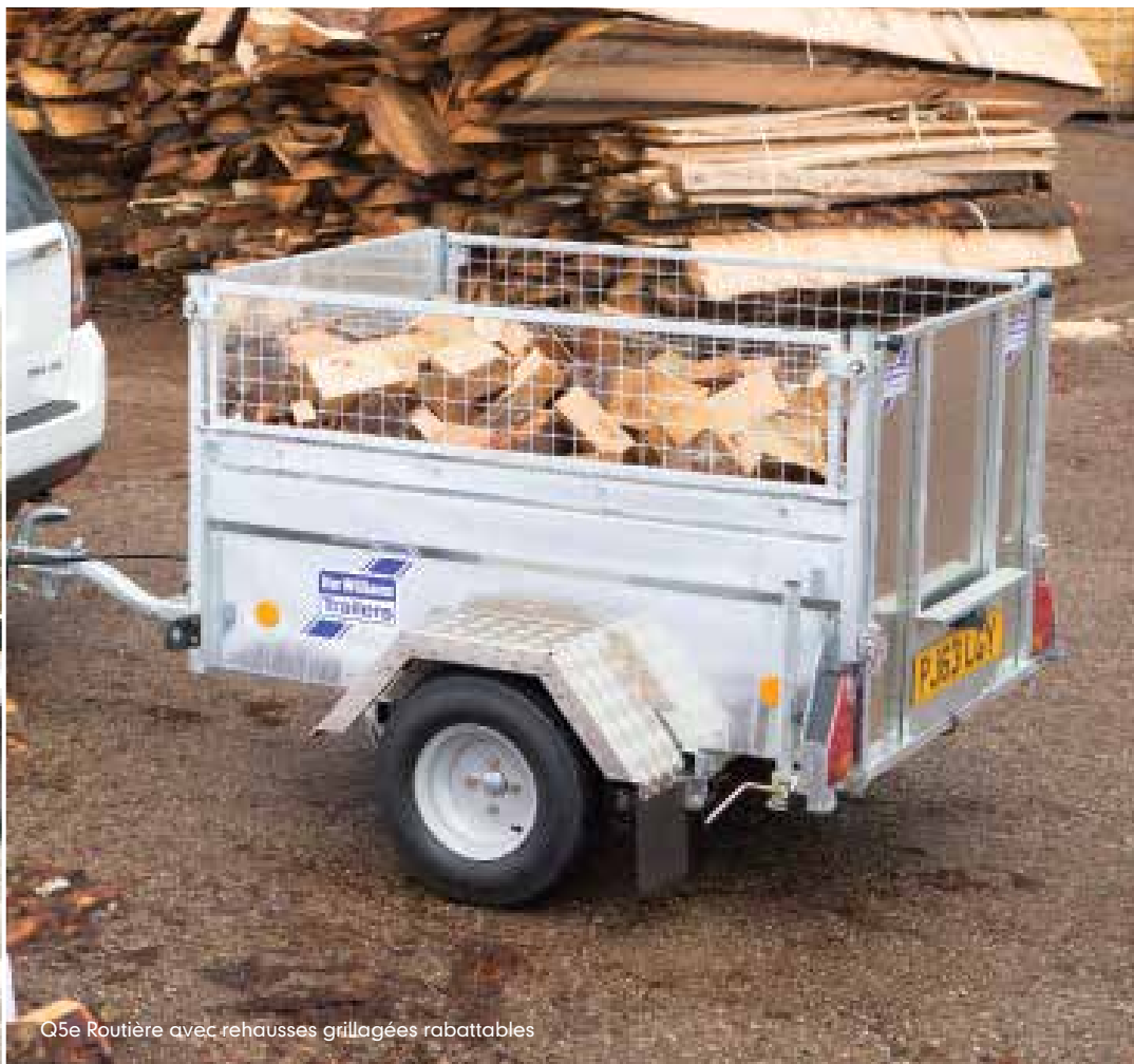
Q5e Routière avec rehausses grillagées rabattables

*merci de vérifier le manuel de l'utilisateur du véhicule pour les renseignements concernant la limite supérieure de tractage non-freiné