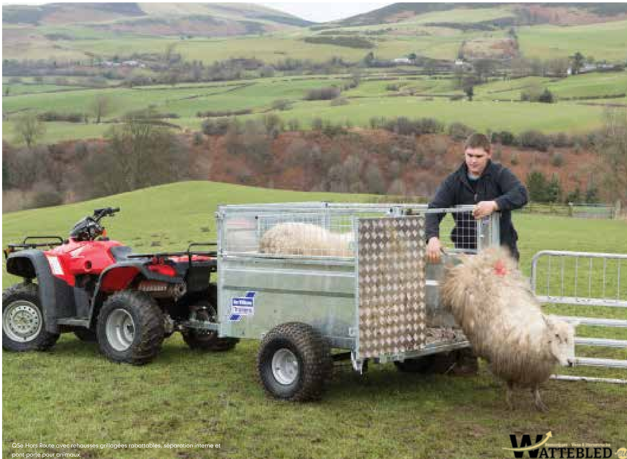
Q5e Hors Route avec rehausses grillagées rabattables, séparation interne et pont-porte pour animaux.