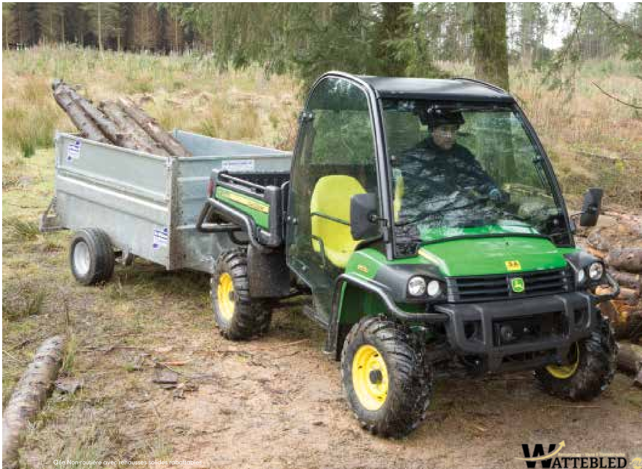
Q6e Non-routière avec rehausses solides rabattables