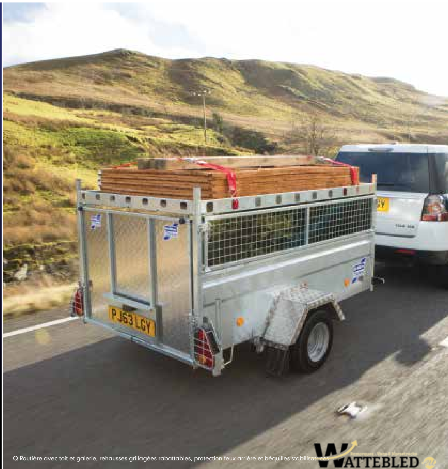
Q Routière avec toit et galerie, rehausses grillagées rabattables, protection feux arrière et béquilles stabilisatrices

Nous sommes une entreprise indépendante avec un seul objectif : construire les meilleurs produits du marché. Plus de 30,000 personnes choisissent nos remorques chaque année, mais nous nous n'arrêtons pas là. L'investissement que nous consacrons aux nouveaux matériaux et aux nouvelles technologies nous permet de continuer de dépasser les attentes de nos clients. Nous savons que la qualité, la robustesse et le rapport qualité/prix et la facilité d'entretien sont pour vous d'une importance cruciale. C'est pourquoi nous en avons fait le fil directeur de toutes nos actions.