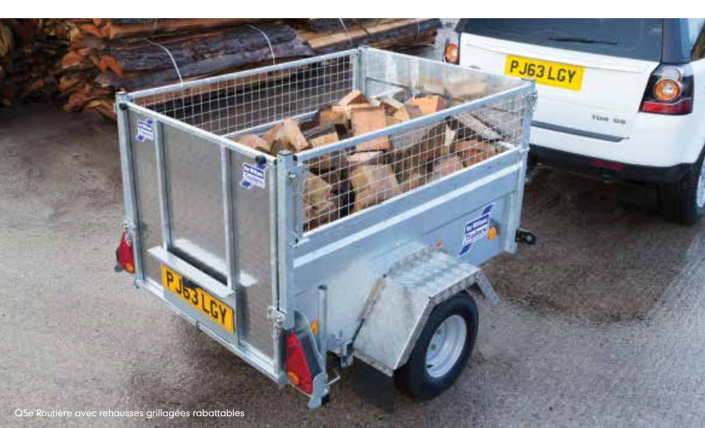
Q5e Routière avec rehausses grillagées rabattables